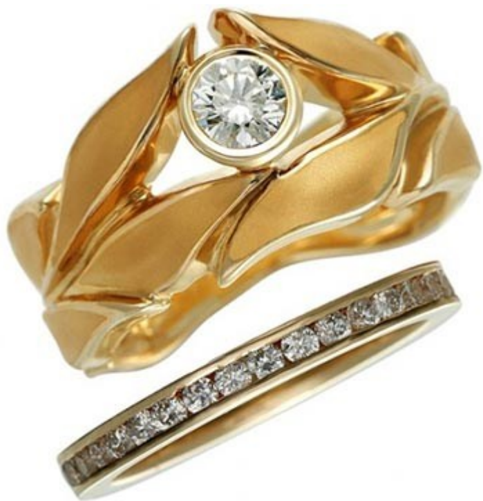
حلقه سلطنتی یونان