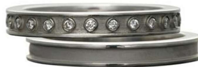
حلقه سلطنتی اسپانیا