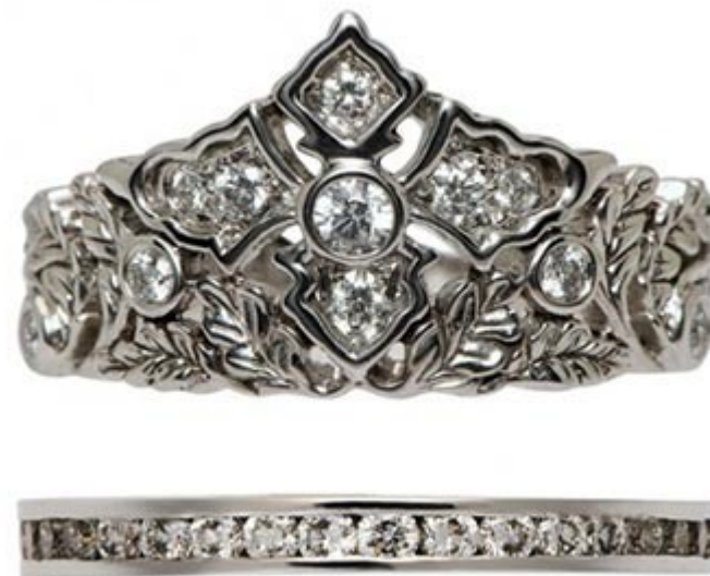
حلقه سلطنتی فرانسه